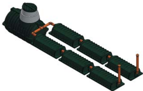
Септик «Rostok» Коттеджный + 8 ДТ