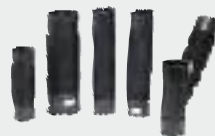
Универсальные гибкие фитинги