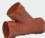
Фитинги Ultra Rib2