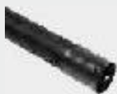
Трубы дренажные с перфорацией SN8